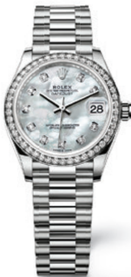
OYSTER PERPETUAL DATEJUST 31 IN 18 K. WEISSGOLD